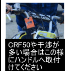
CRF50や干渉が多い場合はこの様にハンドルへ取付けてください